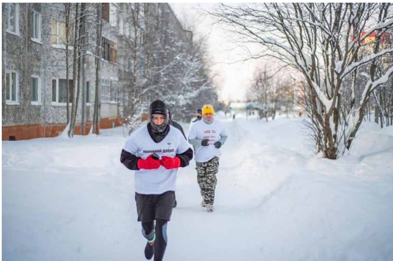
1 января Советы отцов по всей стране присоединяются к акции «Трезвая пробежка»