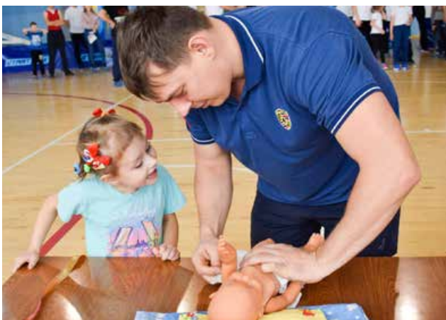
В Иваново отцы провели спортивно-развлекательный праздник #ЯСуперагент