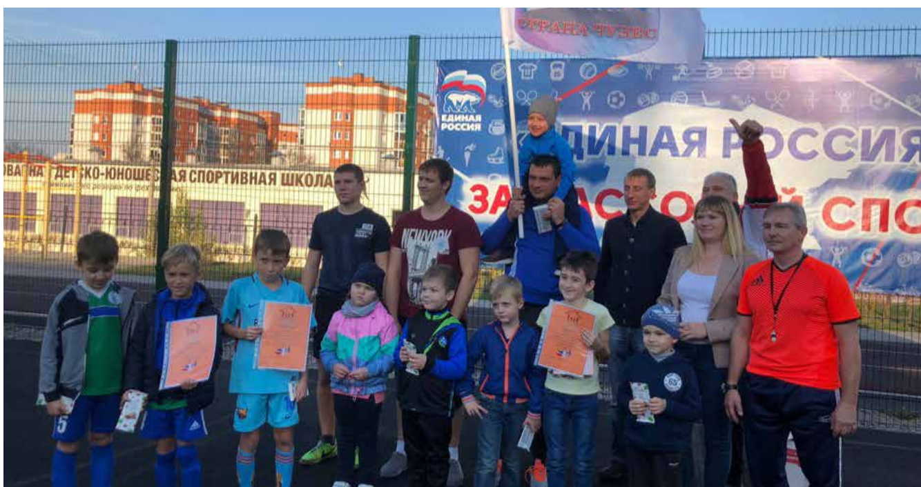
Совет отцов Курской области провёл футбольный турнир на Кубок Уполномоченного по правам ребёнка