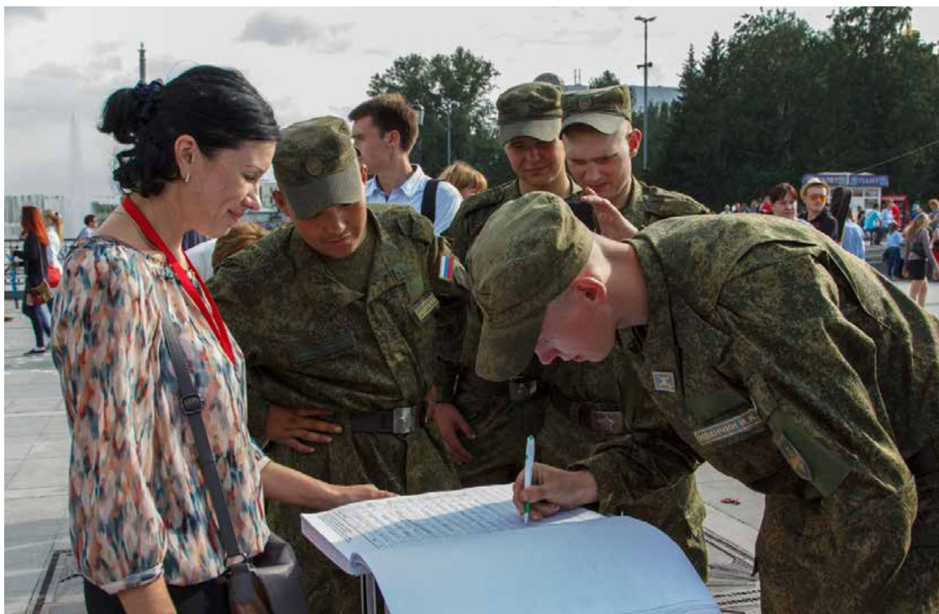
Сбор подписей за учреждение Всероссийского Дня отца

УЧРЕЖДЕНИЕ ПРАЗДНИКА, НАПОМИНАЮЩЕГО ОБ ОТВЕТСТВЕННОЙ РОЛИ ОТЦОВСТВА И ЕЁ ПРЕСТИЖНОСТИ, СТАНЕТ БОЛЬШИМ ШАГОМ В РАМКАХ СЕМЕЙНОЙ ПОЛИТИКИ И СОХРАНЕНИЮ САМОБЫТНОСТИ НАШЕЙ СТРАНЫ.