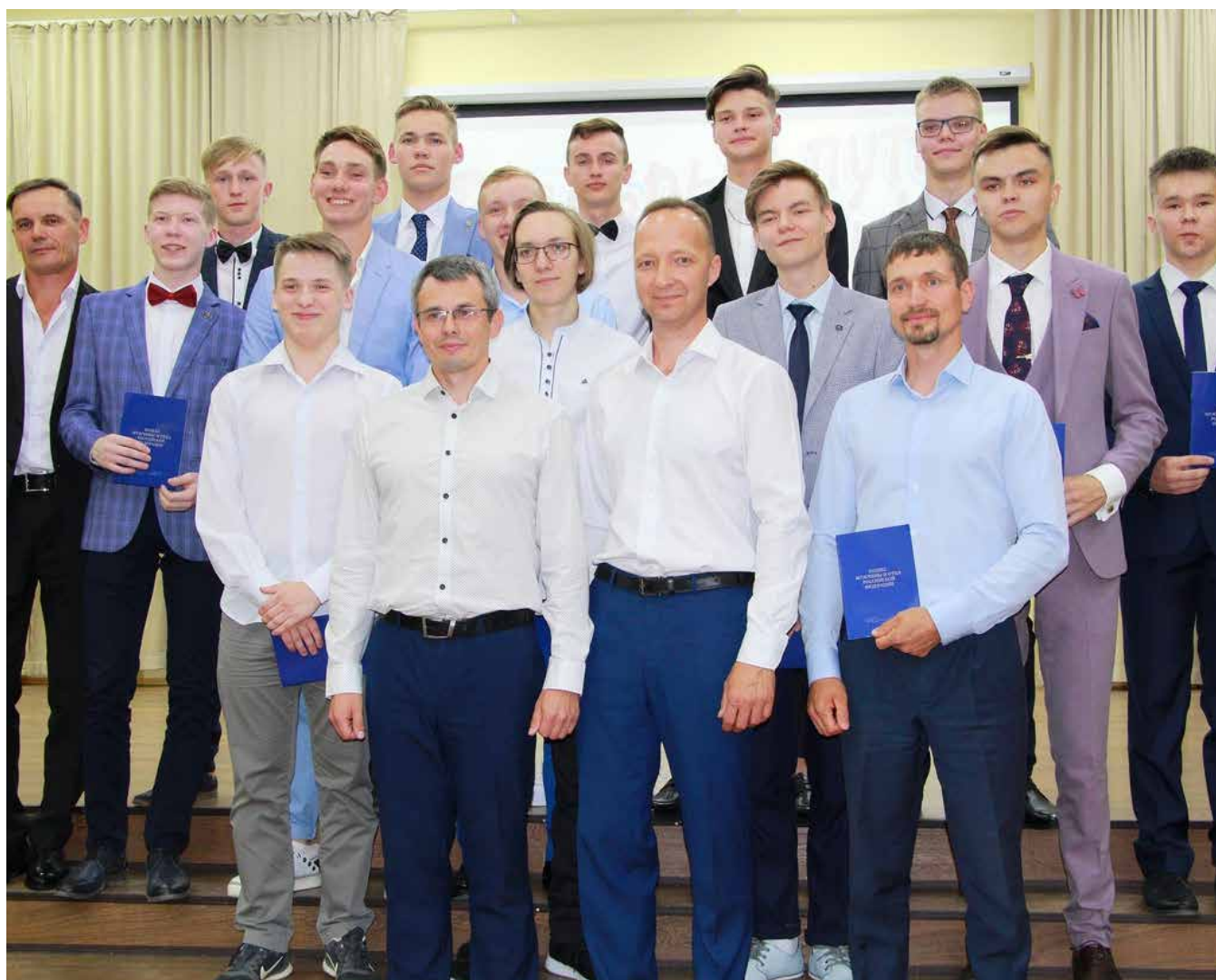
Вручение Кодекса выпускникам МБОУ «СОШ № 17» г. Новочебоксарска Чувашской Республики

КОДЕКС ВРУЧАЕТСЯ ВЫПУСКНИКАМ ШКОЛ ВМЕСТЕ С АТТЕСТАТОМ.