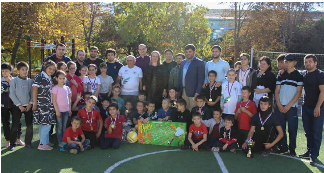
Совет отцов Республики Дагестан организовал поездку в социально-реабилитационные центры для несовершеннолетних детей с программой спортивного наставничества